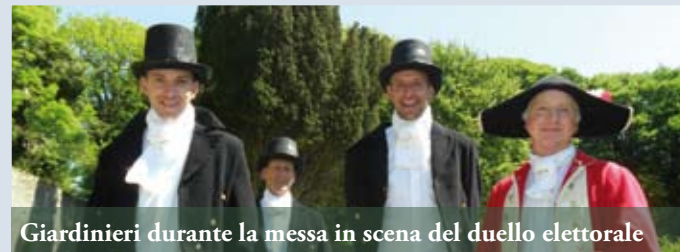
Gardinieri durante la messa in scena del duello elettorale